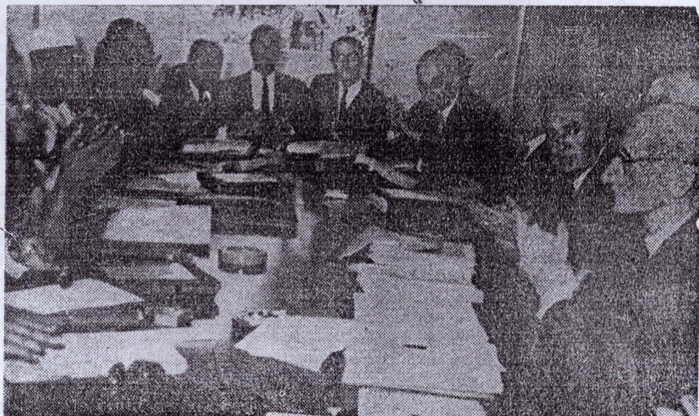
Une vue de la salle des conférences du ministère des Affaires Etrangères lors de l'ouverture de la réunion du